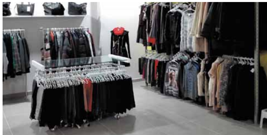
imagen (mas corporativa) y tras haber pasado por el proceso de reutilización llevado a cabo en el Centro de Inserción Laboral "Valentín Ledesma".

por la población en los contenedores destinados para tal uso y que recientemente han cambiado tanto de mecanismo (para mejorar la seguridad) como de